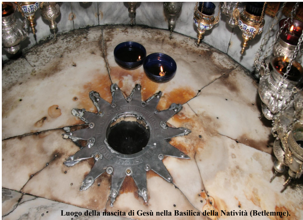
Luogo della nascita di Gesù nella Basilica della Natività (Betlemme).