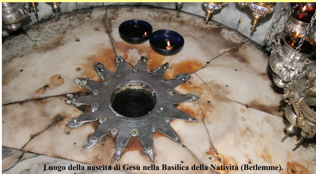
Luogo della nascita di Gesù nella Basilica della Natività (Betlemme).